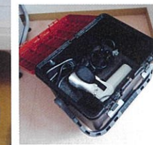
ポータブルレントゲン。