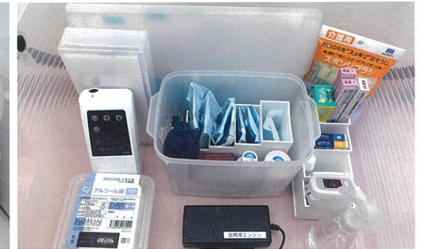
症例により必要な道具を準備。