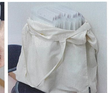
患者さんのカルテ。