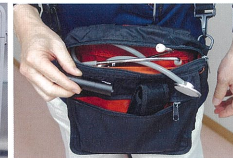
ドクターバッグにはライトや聴診器も。