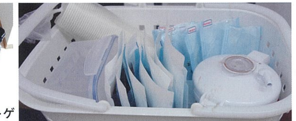
基本セットと患者ごとのケアグッズ。グローブなどの衛生材料は、施設にワゴンを置かせてもらい保管している。