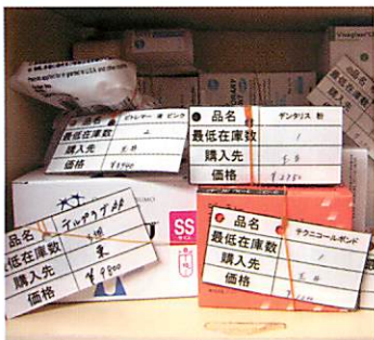
図2 在庫管理カードは、在庫の無駄をはぶく“カンバン方式”を参考に作成した。ラミネート加工をほどこしたカードには、品名、最低在庫数、購入先、価格が記入してある。新しく在庫から取り出すたびに、自然とコストを意識するようになった。最低在庫数を下回ったら、ホワイトボードの「注文」欄（図3参照）に移動させ、新たに発注する