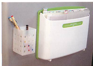
図6 収納ポケット。治療説明用資料、リコールハガキなどを収納。座ったままで、必要な書類が出せるように何度も改良している