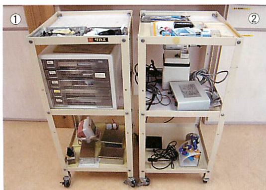
図4-①、② ① コンポジットレジン充填用ワゴン、② 根管治療用ワゴン。ワゴンには治療に必要な材料、備品をすべて収納した。配置をすこしずつ変え、可能な限り効率的に仕事が行えるように検討した