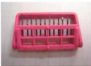
図7-1、2 バー管理の徹底（見える化）。誰が見てもバーの種類、順番、紛失の有無が一目でわかるよう、消毒ルームにバーの収納時の並び順を貼り出した