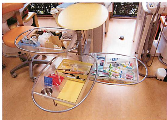
図5 両サイドのユニットから取り出せる引き出しにエプロン、アルコールランプ、滅菌済タービン、バースタンド、セメント類などをコンパクトに収納