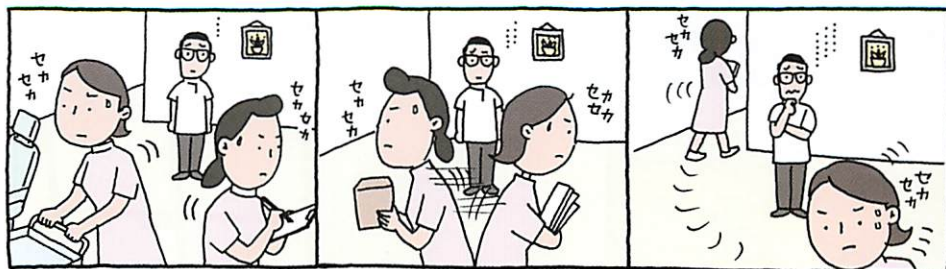
図1 改革前の当院では、スタッフ一人ひとりの仕事の負担が多く、院内の雰囲気が悪化していた

とスタッフの多くが新人という状況のなか、各々の仕事の負担は重くなる一方で、院内の雰囲気は悪化していました(図1)。“このままではいけない”と思った私は、まず、外部からスタッフ教育の専門家を招き、指導を仰ぐことを決意しました。